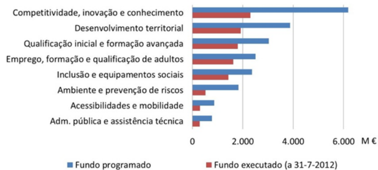
Gráfico 5.2 - Execução do QREN (a 31 de Julho de 2012) por domínio de investimento

No final de julho de 2012, o QREN verificava uma taxa de execução de 48%, correspondendo a 10,2 mil milhões de euros de fundos comunitários, 3 mil milhões de euros de financiamento público nacional e 2,2 mil milhões de euros de financiamento privado. As taxas de execução (fundo programado/fundo executado) variavam nos diferentes domínios de investimento, refletindo aspetos tão diversos como a disponibilidade financeira dos promotores (públicos e privados), o volume e a natureza mais ou menos pontual dos investimentos, ou as dinâmicas de execução e de gestão dos programas. De uma forma geral, os programas financiados pelo Fundo Social Europeu (onde se destacam os investimentos na qualificação inicial, na qualificação de adultos e na formação avançada) registavam níveis de execução superiores à média, o que reflete, em larga medida, o facto de se tratarem de programas financiadores de sistemas públicos, com maior previsibilidade em termos institucionais de procura e de financiamento.