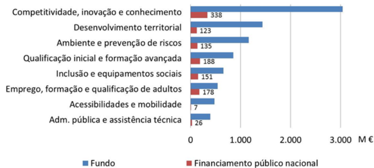
Figura 5.3 - Previsão da execução do QREN após 2012 por domínio de investimento

Não sendo possível estimar com rigor o perfil temporal de execução do QREN após 2012, prevê-se que os valores referidos sejam distribuídos equitativamente entre 2013 e 2014, tendo em conta os valores previstos na programação anual dos Programas Operacionais do QREN, na sequência das propostas de reprogramação do corrente ano apresentadas à Comissão Europeia.