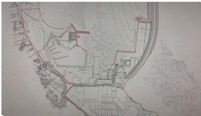
Imagem 1

Considerando que a alínea m) do ponto 1, do artigo 12.º - Secção III - determina que à Portos dos Açores, S.A. compete “Estabelecer quando necessário, acordos com outras entidades públicas legalmente competentes relativamente à gestão do domínio, constituição de usos e coordenação de atividades para fins de natureza não portuária;”.