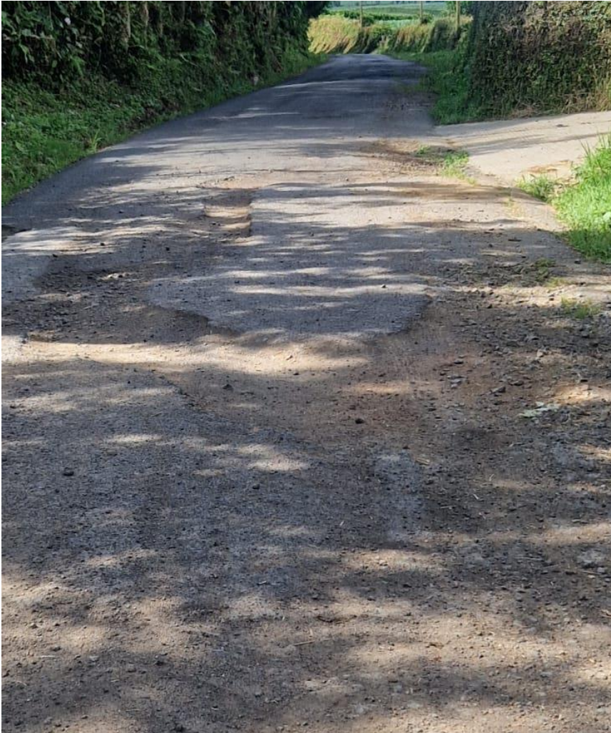
Deposição de entulho nos últimos 2 anos – entroncamento entre o caminho dos Barreiros e caminho da Lagoa do Conde – Arrifes