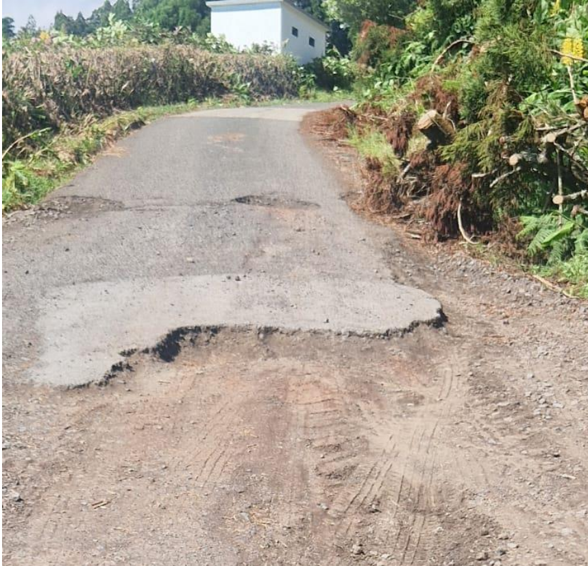
Caminho dos Barreiros – Arrifes