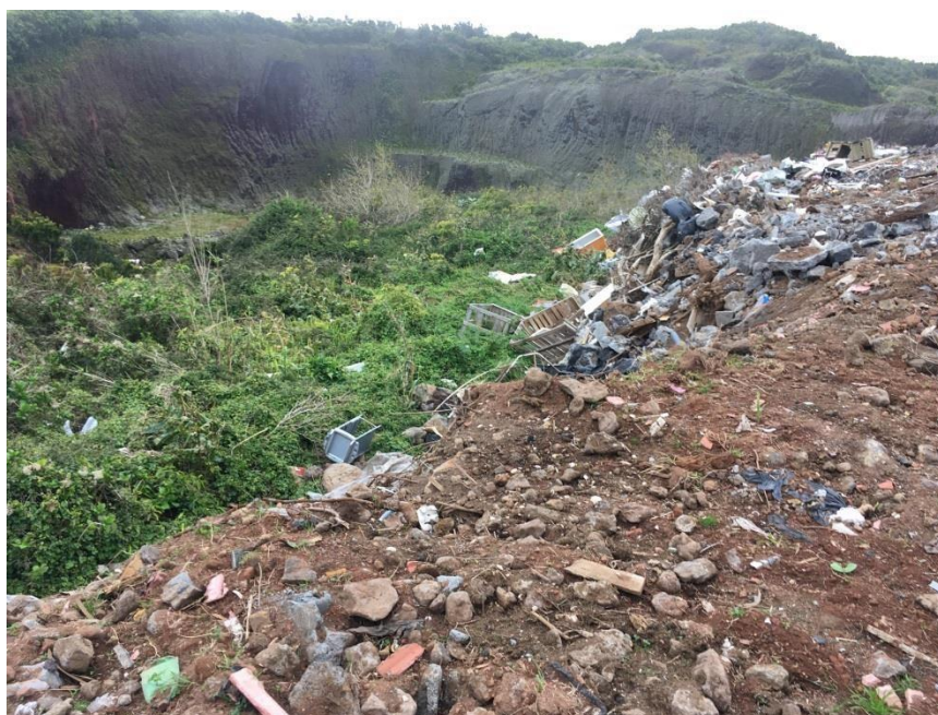
Imagem 2 - Lixeira a Céu Aberto