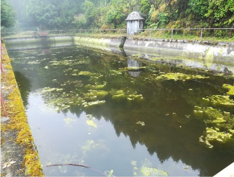
Fig1.- Como é visível o tanque não tem uma manutenção regular.