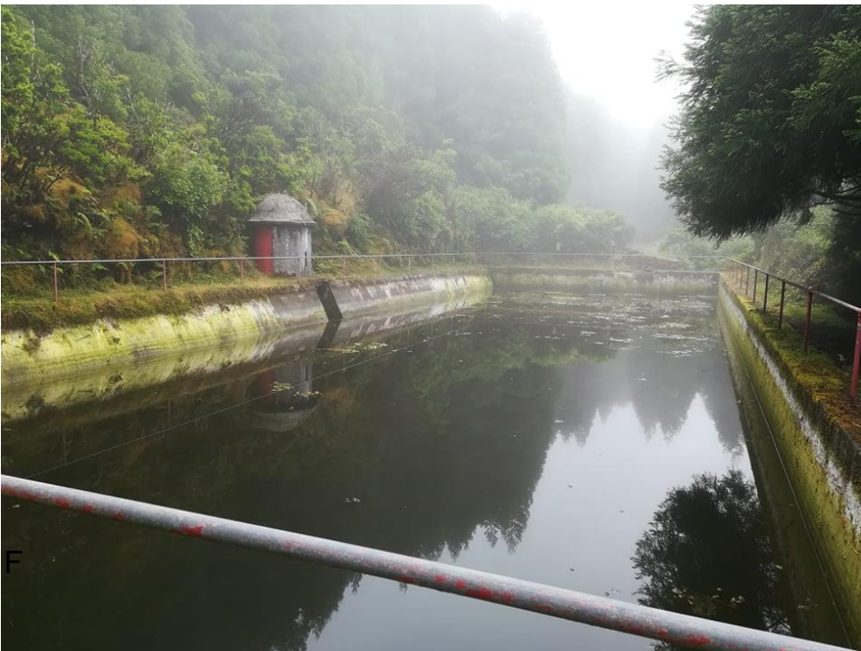
Fig.2.- Comprimento da infraestrutura e o estado de degradação visível