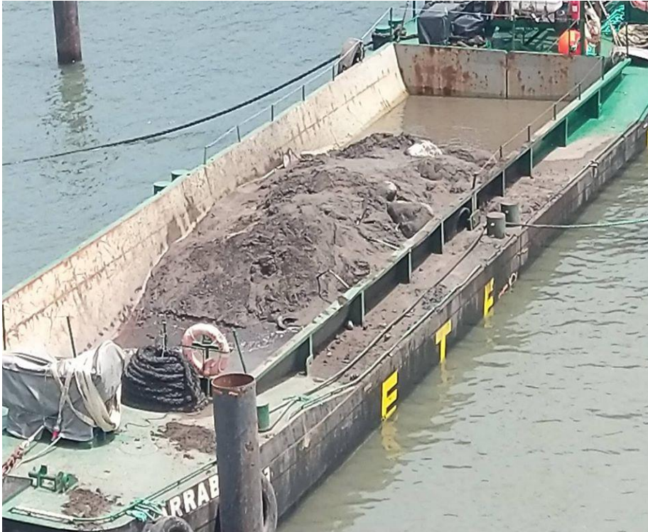
Fig1.- Resíduos retirados no Porto das Lajes das Flores