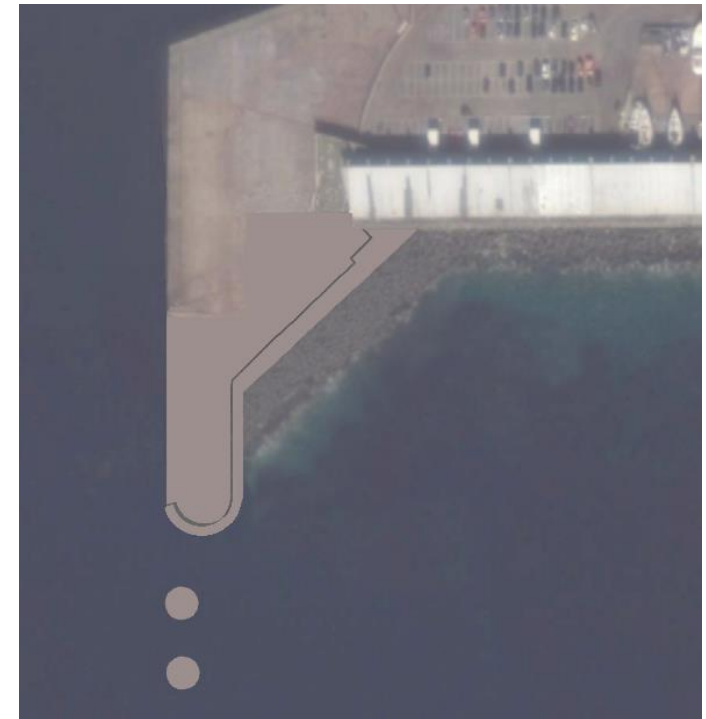
Eliminação do canto de concentração de energia