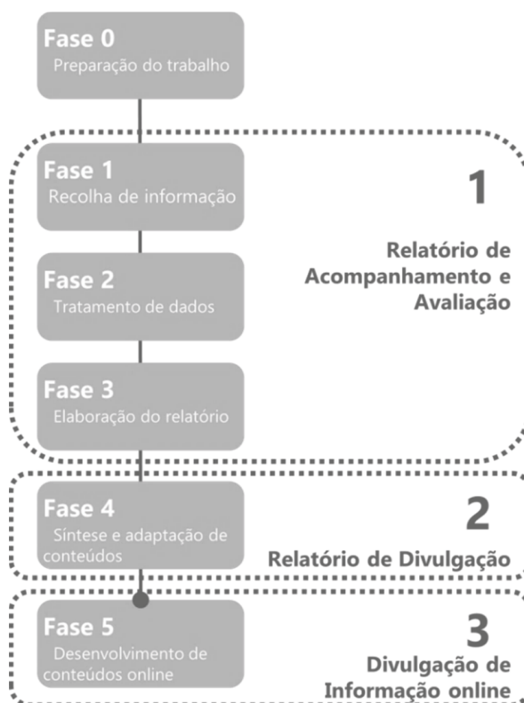
Figura 2 — Fases e produtos do processo de avaliação e acompanhamento do PRA

Para além do Relatório de Acompanhamento do PRA, propõe-se a elaboração de um Relatório de Divulgação, com o objetivo de apresentar de forma eminentemente não técnica os aspetos mais importantes do relatório de acompanhamento. Para além destes dois relatórios, será promovida a divulgação da informação online , que ambiciona conseguir uma maior participação da sociedade civil na implementação do Programa, através da apresentação de novos conteúdos e funcionalidades.